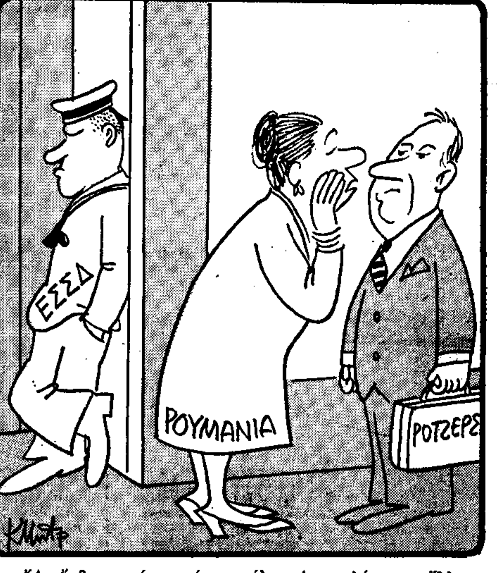
Ἄν ἤρθετε γιὰ γυμναστική, τέλος, Διευκολύνονται ὄλλοι...