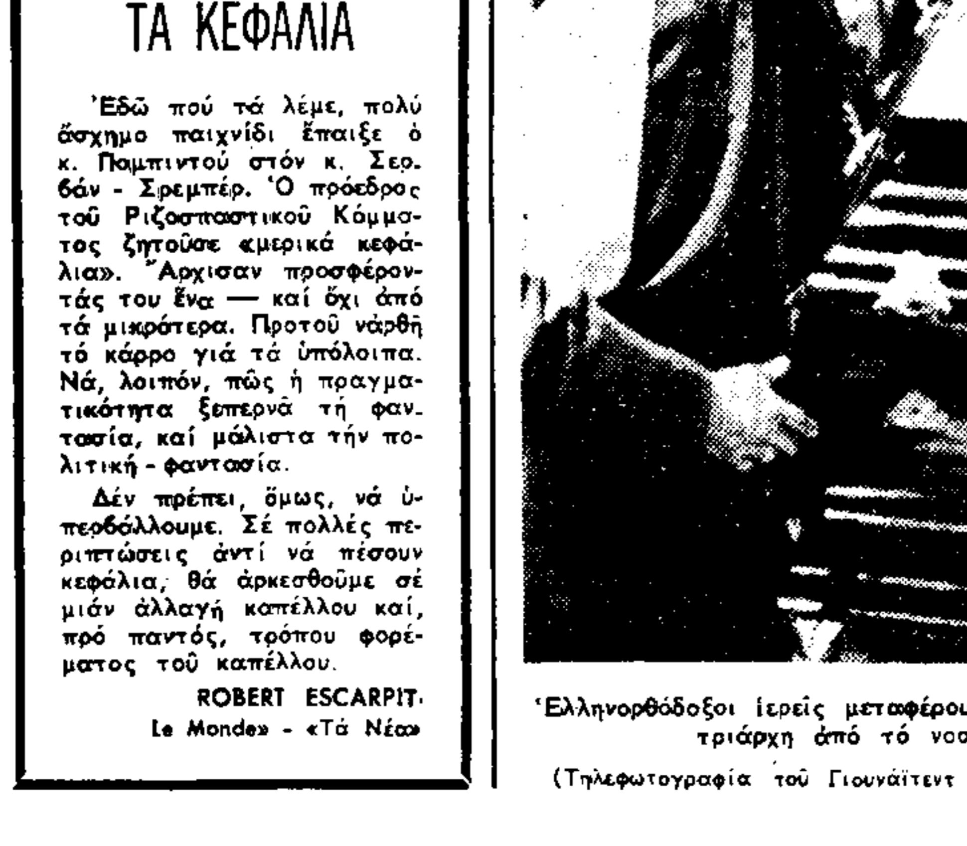
Ἐλληνορθόδοξοι ἱερεῖς μεταφέρουν τὸ φέρετρο μὲ τὸν ἀείψοντα Πατριάρχη ἀπὸ τὸ νοσοκομεῖο, ὅπου ἀπέβητο.